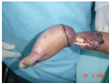
Figura I. Caso 2. Evolución Postoperatoria