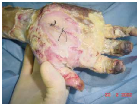
Figura C. Caso 2. Preoperatorio