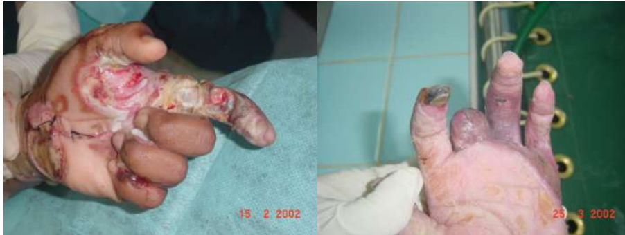
Figura A. Caso 1. Preoperatorio. B. Evolución Postoperatoria