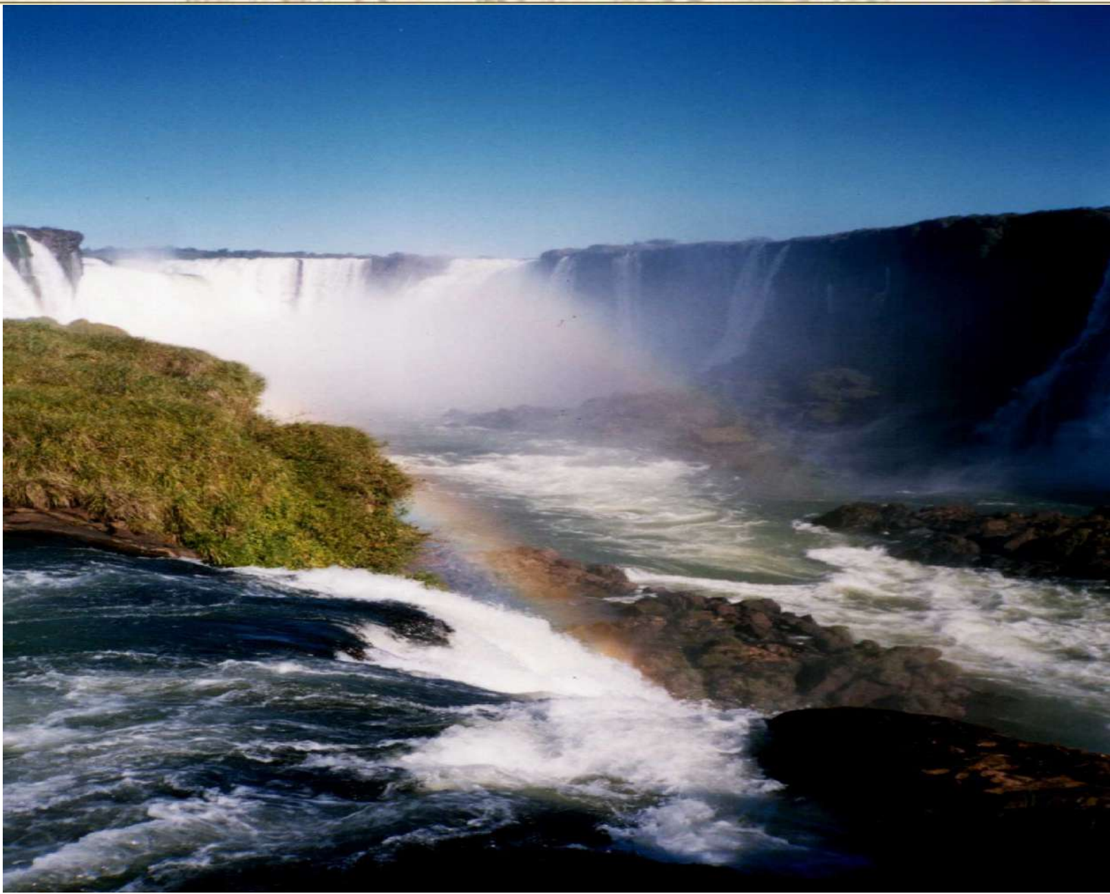
CATARATAS DE IGUAZU, BRASIL Tomadas durante el XV Congreso Científico Internacional de la Federación Latinoamericana de Sociedades Científicas de Estudiantes de Medicina (XV CCI FELSOCEM) Asunción, Paraguay, Agosto 2000.

SOCIEDAD CIENTIFICA DE ESTUDIANTES DE MEDICINA DE LA UCV