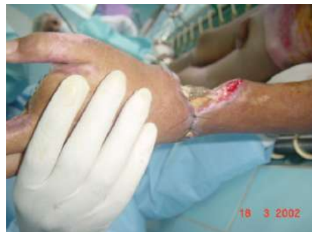
Figura F. Caso 2. Evolución Muñeca Izq.