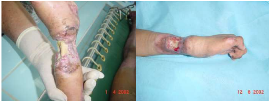
Figura J. Caso 2. Evolución Postoperatoria. K. Evolución Postoperatoria.