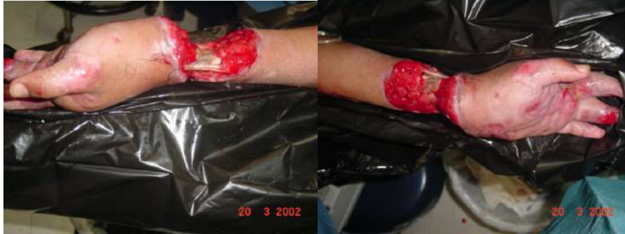
Figura G. Caso 2. Muñeca Izq. H. Muñeca Izq.