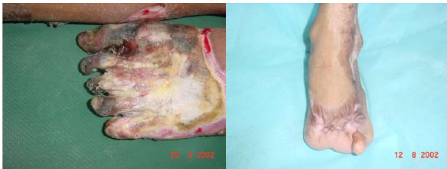
Figura L. Caso 2. Pie Izq. M. Caso. 2 Evolución Postoperatoria.