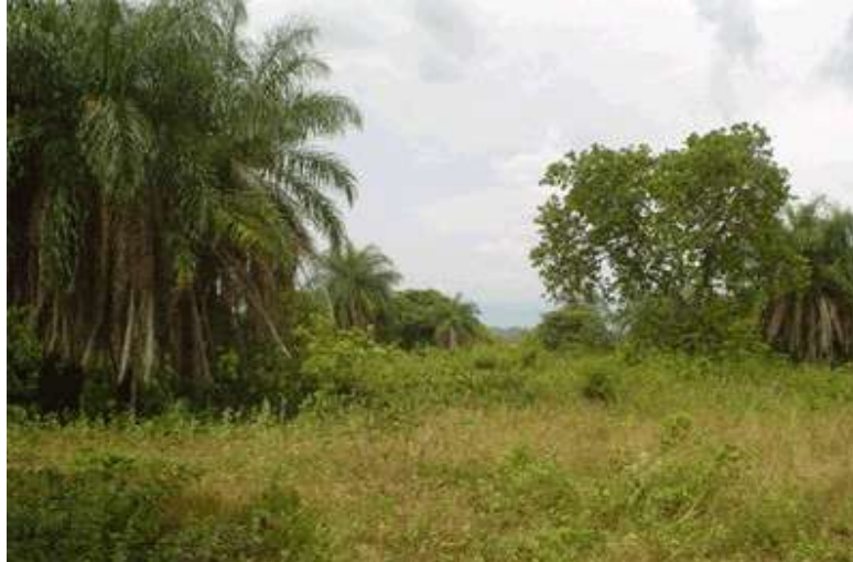
Figura 2. Aspecto característica de una zona con condiciones ecoepidemiológicas apropiadas para la enfermedad de Chagas. La foto fue tomada por el autor en una zona endémica de Enfermedad de Chagas en el estado Trujillo (A. J. Rodríguez Morales).

El proceso de colonización del ambiente doméstico por parte de los triatomíneos suelen iniciarse en lugares del área peridomiciliar estrechamente ligados a la fuente de ingesta sanguínea, como es el caso de cobertizos que albergan animales, entre estos se citan gallineros, establos, gatos, roedores y marsupiales 21,22 .