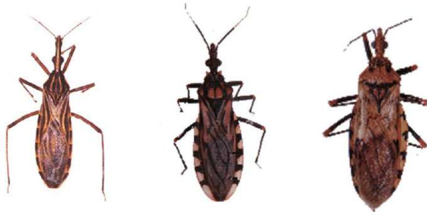
Figura 1. Principales vectores de la enfermedad de Chagas en Venezuela (izq: Rhodnius prolixus ; centro: Triatoma maculata ; der: Panstrongylus geniculatus ).

Esta enfermedad, es uno de las más serias parasitosis en Latinoamérica, constituyendo un gran impacto social y económico con respecto a otras enfermedades.